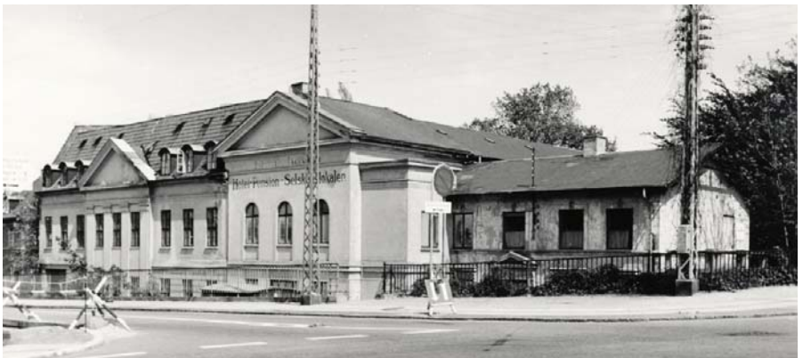
Palmehaven set fra Fredensvej i 1965 – etablissementet lukkede i midten af 50'erne og blev revet ned i 1966. Der ligger nu et supermarked på grunden.