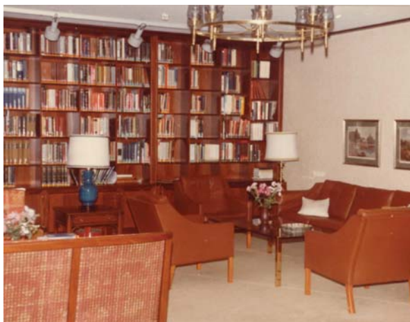
Dagligstuen i Domus Hagedorn