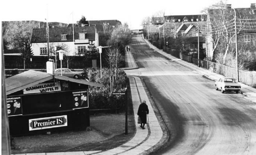
Stolpegårdsvej. Ejendommen nr. 10 ligger til højre i