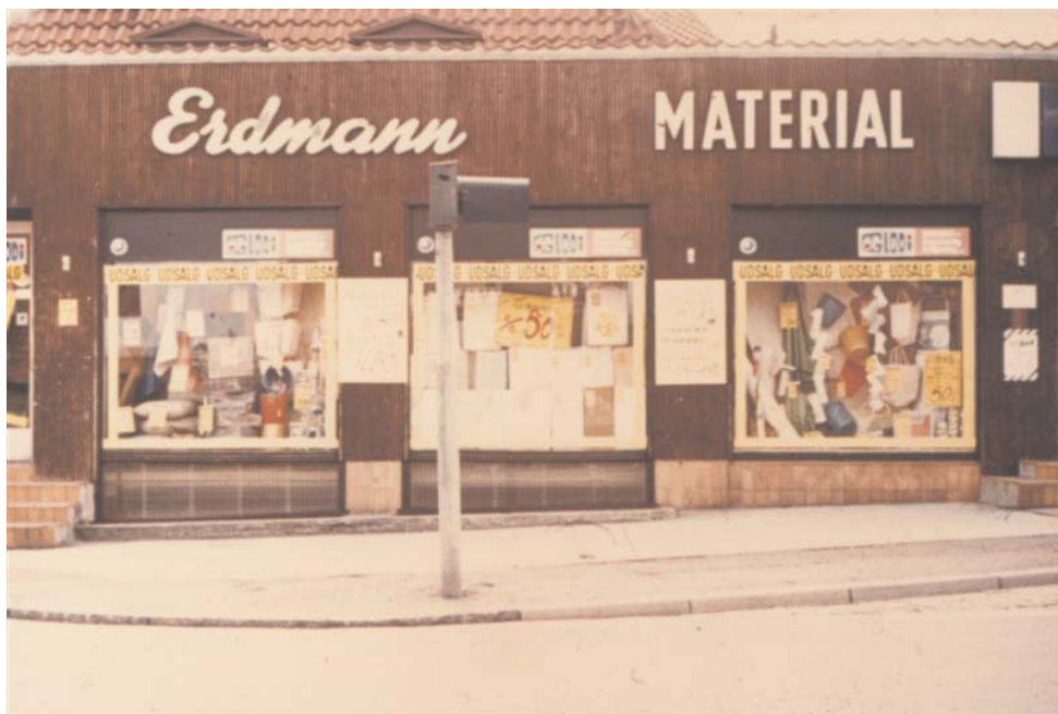
Erdmanns materialhandel ved Vangede Station