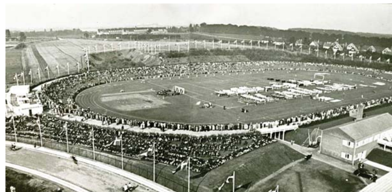
Luftfoto af Gentofte Stadion ved indvielsen i 1942.

Lidt malurt i bægret i en ellers veldrevet klub er dog at vi på 5. år endnu ikke har fået det lovede klubhus, selv om kommunalbestyrelsen har bevilliget penge for flere år siden.