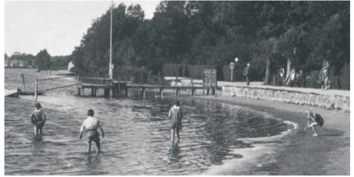
I 1930-erne kunne man godt bade i Gentofte Sø.

at komme derind og det var ikke noget, man havde penge til, når man var fra Vangede.