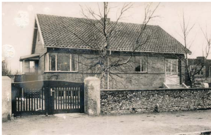
Huset på Mosegårdsvej