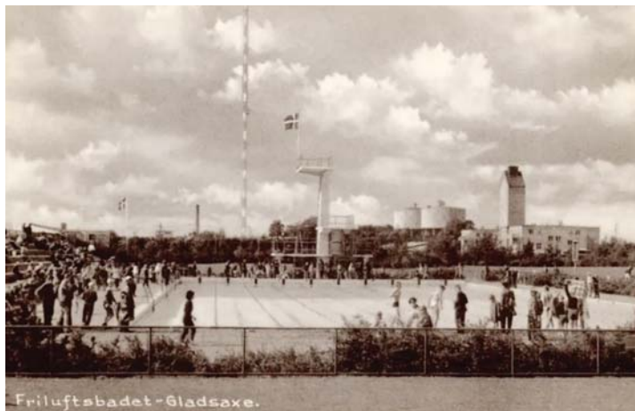
Friluftsbadet-Gladsaxe. Postkort privateje

På Bellevue var der strand til pøblen og strand til "de fine". Der var et hegn med en låge ind til "de fines" strand, hvor der var bruser og omklædningskabiner. Det kostede et eller andet