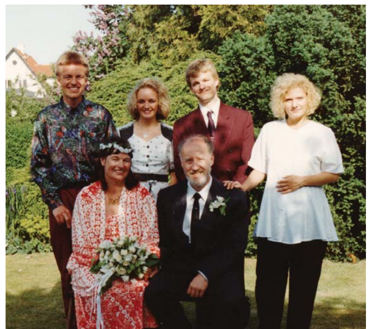
Hele familien ved brylluppet

Men nu skriver vi 2023 og jeg er her stadig – efter 34 år i denne lille, charmerende ”landsby” Vangede, hvor kimen til ”mig” blev lagt!