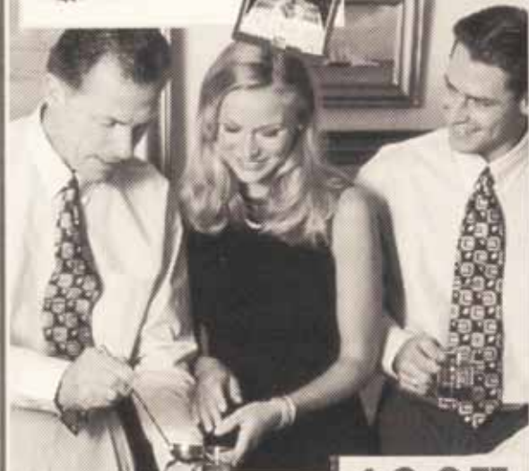
Morgan fine chambrey skjorte i flot kvalitet

Nu er vores inspirerende julekatalog på gaden. Hvis du ikke har fået et eksemplar er du velkommen til at kigge ind hos os.