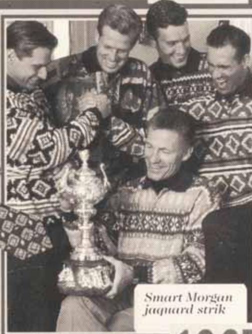
Smart Morgan jaquard strik