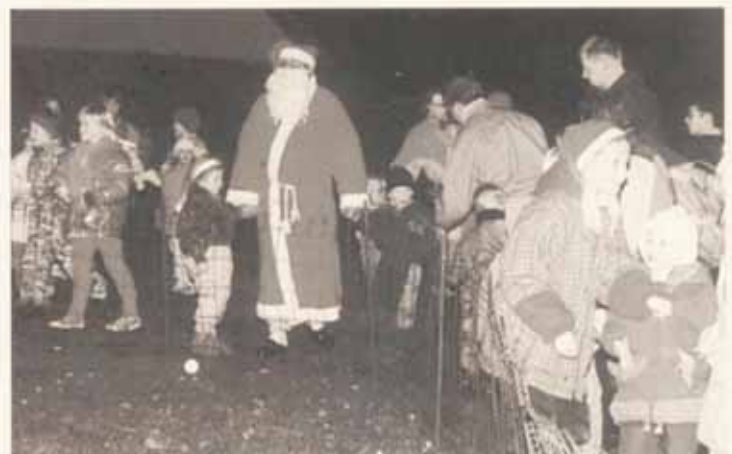
Vi var med da Vangede's juletræ blev tændt, fredag den 18.11.1994

Freilley SNOGEGÅRDSVEJ 3 TLF. 31 65 10 26