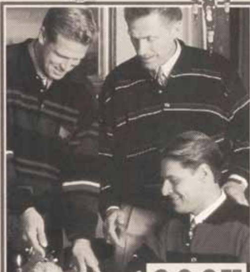
Flot italiensk Morgan strik med polokræve.