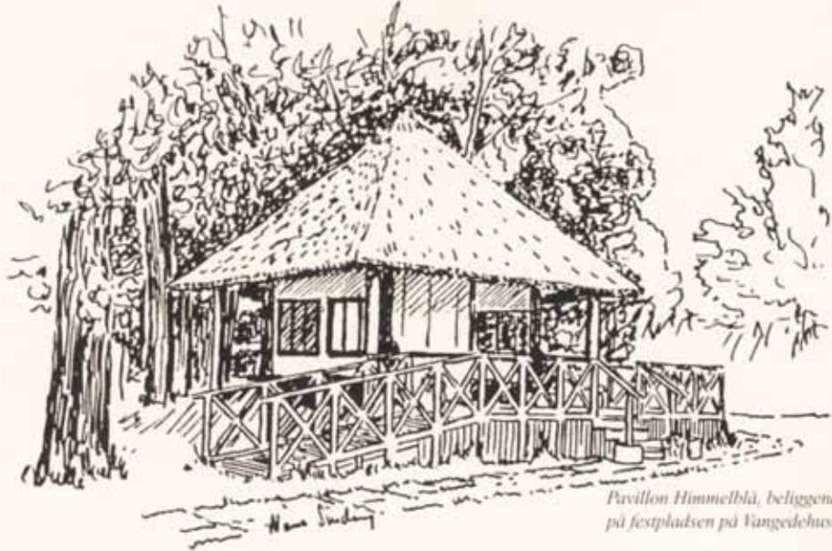
Pavillon Himmelblå, beliggende på festpladsen på Vangedehuse

Den jord, som Vangedehuse er beliggende på, indgår i beskrivelser meget langt tilbage i Danmarkshistorien. Om navnet Vangede ved man fra de ældst bevarede kilder fra 1300-tallet, at stedet oprindeligt hed "vang vith". Navnet menes at stamme fra omkring 800 e.Kr. "Vith" betyder skov og "vang" et stykke jord til græsning. Vangede var en græsslette i en skov, som blev bebygget for ca. 1200 år siden.