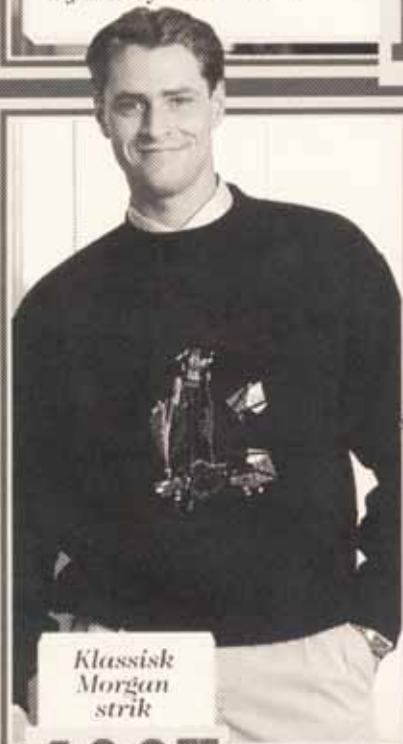
Klassisk Morgan strik