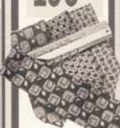
Slipsholder - altidens julegaveidé